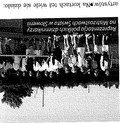
Reprezentacja polskich dziennikarzy na Mistrzostwach Świata w Słowenii